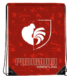
VREĆICA ZA PATIKE