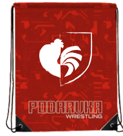
VREĆICA ZA PATIKE