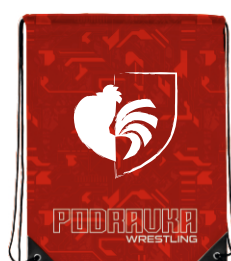
VREĆICA ZA PATIKE